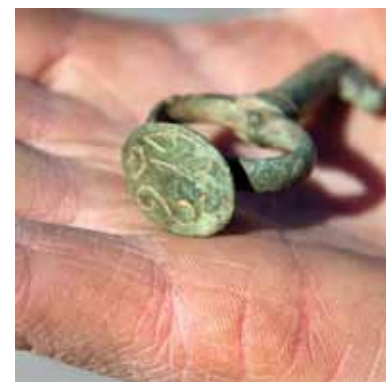
Nøkkel med eget segl i enden, fra 1700- tallet.