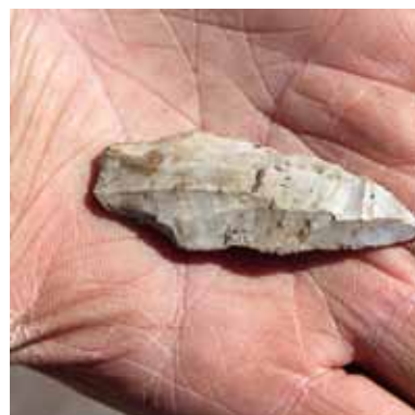
En pilspiss i flint som kanskje er 10.000 år gammel, ble funnet ved en tilfeldighet i helgen.