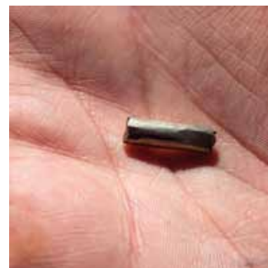
Betalingsenhet i sølv, såkalt «klippesølv» fra Vikingtiden.