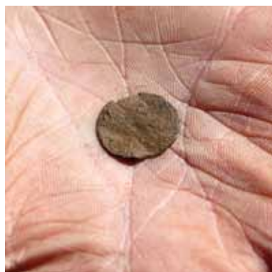
En tysk mynt som ble brukt som betalingsmiddel i tidlig middelalder.