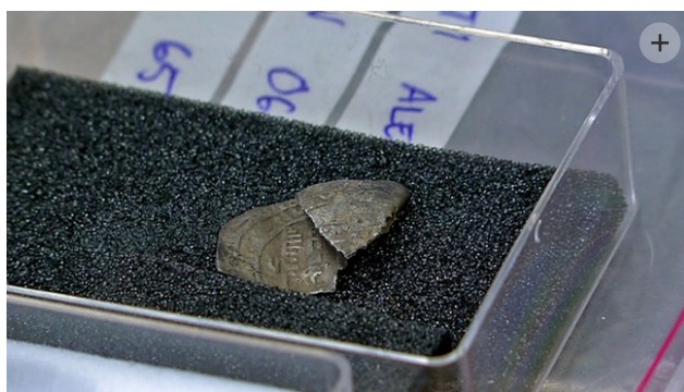
Denne mynten kommer fra et arabisk land. Man kan se den arabiske skriften.